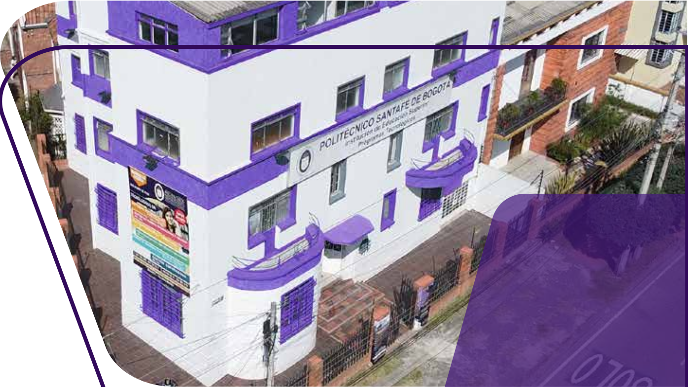
Transversal 18A BIS. #37-11