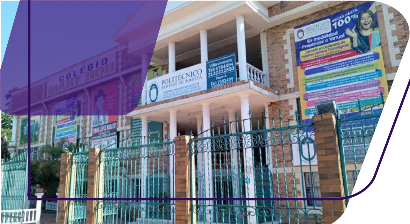
Carrera 33n # 22-64